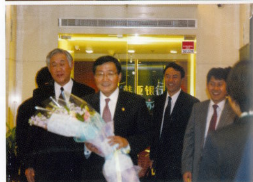
▲上图为韩国金融委员会全光宇委员长访问韩亚银行(中国)和听取业务报告